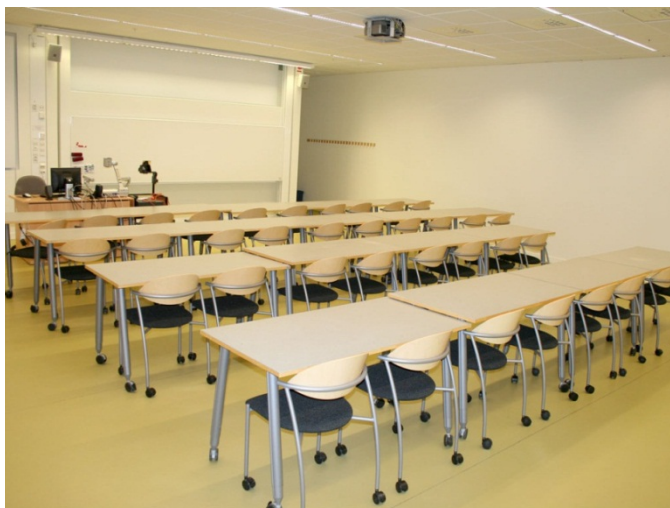
Figur 1. Sal A1 119 tiden innan ombyggnationen 2015.

Den sal vid pedagogen som fram t.o.m. början av vårterminen 2016 kom att byggas om till en ALC-sal var A1 119 (se figur 1). Det var en relativt traditionsenlig sal, dock med ett undantag och det var att den var fönsterlös. Något som inte skulle komma att ligga ALC utformningen i fatet.