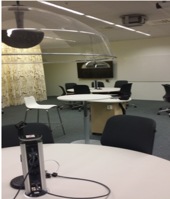
Figur 2. Sal A1 119 efter ombyggnationen till en ALC-sal, läsåret 2016.

Till varje runt bord hör också en bildskärm, en whiteboard, en "ljuddusch" (högtalare) och en knappsats för styrsystemet. Bildskärm och whiteboard är till för att synliggöra tankestrukturer och för kunskap ska kunna delas och utvecklas ur ett kollaborativt förhållningssätt (se vidare Brooks, 2011). I salen finns också en projektor med projektorduk, vilket endast kan aktiveras från lärarens/rummets peksskärm. Bakom ett draperi finns ett väggskåp där trådlösa och uppladdningsbara mikrofoner och head-set finns för de som så önskar. Rummet är väl ljudisolerat så ibland kräver form och innehåll såväl mikrofoner hos deltagare som för den/de som ansvarar för aktiviteterna i rummet.